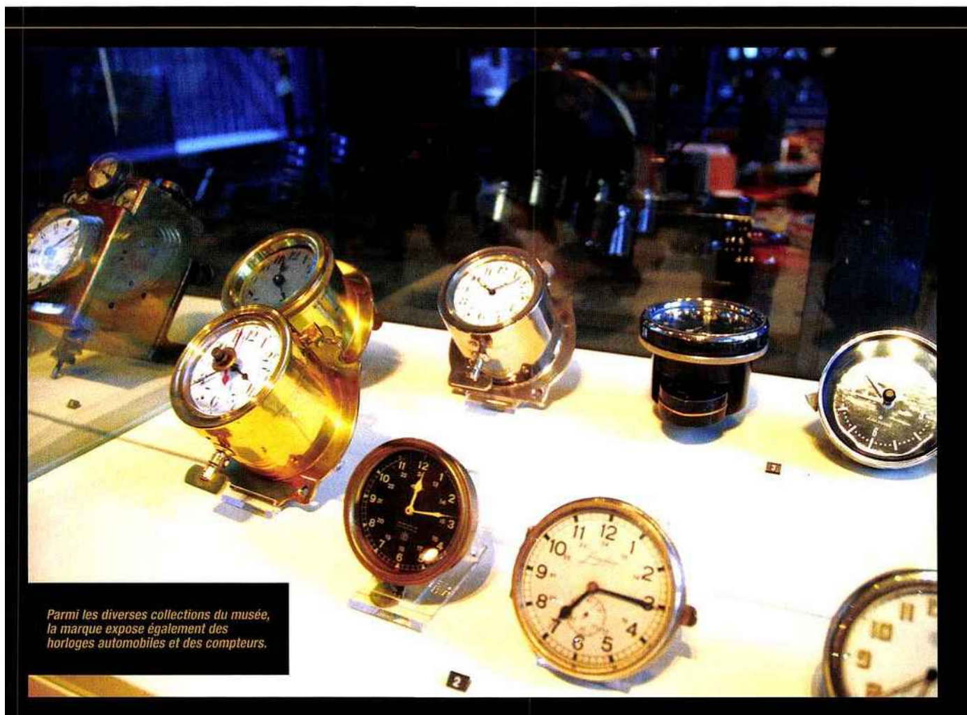
Parmi les diverses collections du musée, la marque expose également des horloges automobiles et des compteurs.

tendances et leur faisabilité. Ce processus créatif est la base de chacune des montres Junghans. Et cela depuis plus de 150 ans. Les différentes technologies telles que le radio-pilotage, la mécanique ou la technologie quartz requièrent des outils de précision qui sont parfois uniques et inventées sur place. La production n'est lancée que lorsque tous les composants nécessaires ont passé avec succès le contrôle de qualité et ont été validés. Après le montage du cadran, la pose des aiguilles et l'emboîtement, la montre passe une première série de tests techniques. Par exemple, une montre radio-pilotée